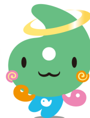
埼玉県社協マスコット 「シャキたまくん」